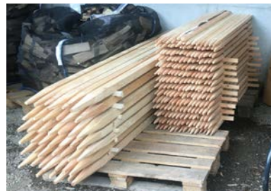
Produkte aus Kaltbrunner Holz - vo do wo's gwachse isch.

Ob Bänkli, Brennholz oder Pfähle allesamt aus Kaltbrunner Holz gefertigt – dank dem neuen Holz-Onlineshop lassen sich diese Dinge ganz einfach und unkompliziert beim Forstbetrieb bestellen.