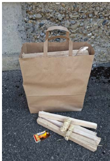
Das Sorglospaket bietet nebst Brennholz auch Anfeuerholz, Zündwürfel und Streichhölzer.

Im neuen Holz-Onlineshop können Holztaschen für CHF 10 erworben werden. Sie garantieren als Sorglospaket für knapp zwei Stunden Brätlispass. Natürlich mit Kaltbrunner Holz. Mit dabei sind auch das Anfeuerholz, die Zündwürfel und die Streichhölzer.