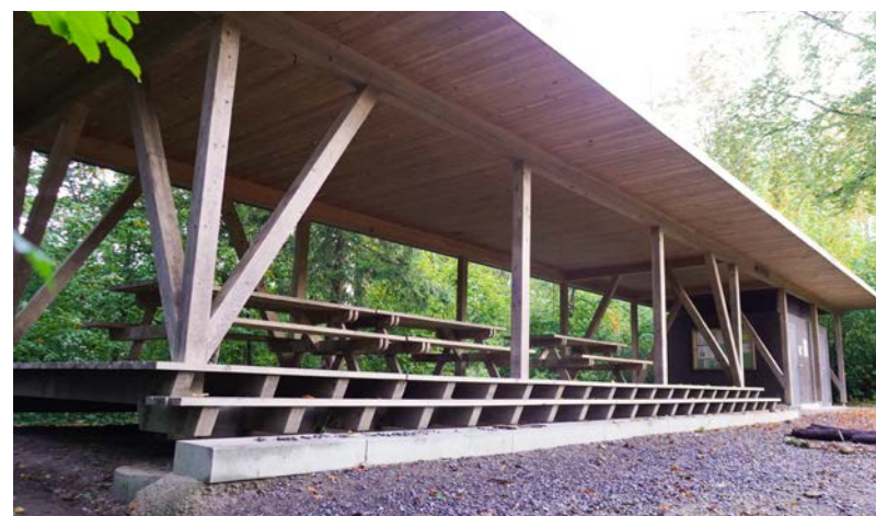
Die Unterstände und Grillstellen können am Waldlehrpfad neu noch unkomplizierter reserviert werden.

Nach wie vor gilt, dass die Anlagen sauber zu hinterlassen sind und der Abfall zum Entsorgen mit nach Hause genommen wird. Sorgfalt gegenüber den anvertrauten Objekten, aber auch gegenseitige Rücksichtnahme und Toleranz gegenüber den anderen Besuchern bleiben das Rezept für einen reibungslosen Betrieb am Waldlehrpfad.