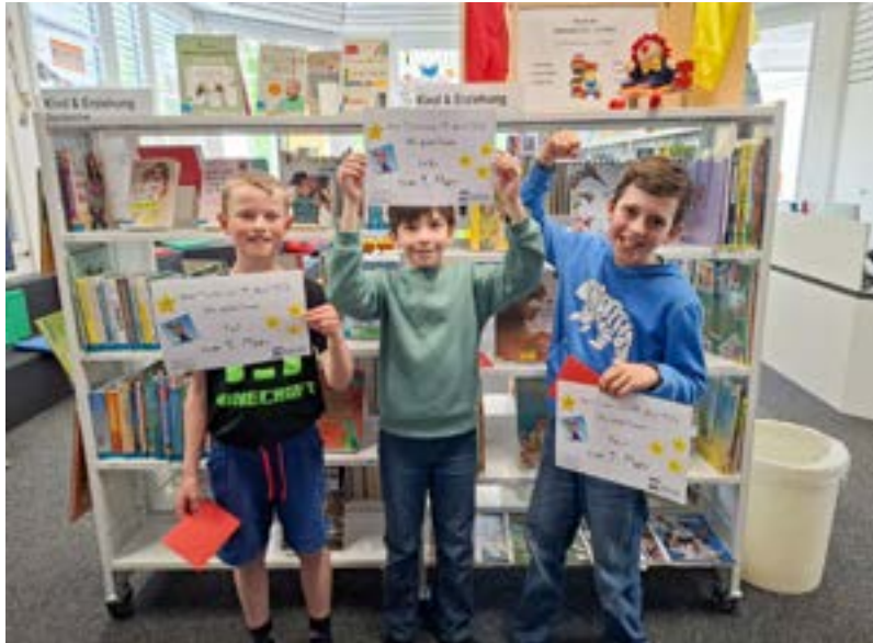
Herzliche Gratulation den Gewinnern!

Anlass teil. Wir freuen uns bereits auf den nächsten Anlass, der am 9. Dezember 2026 stattfindet.